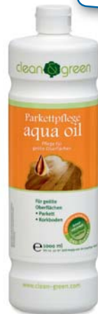
Средство по уходу за паркетным полом aqua oil

Для белого паркета с пропиткой маслом рекомендуется средство aqua oil white.