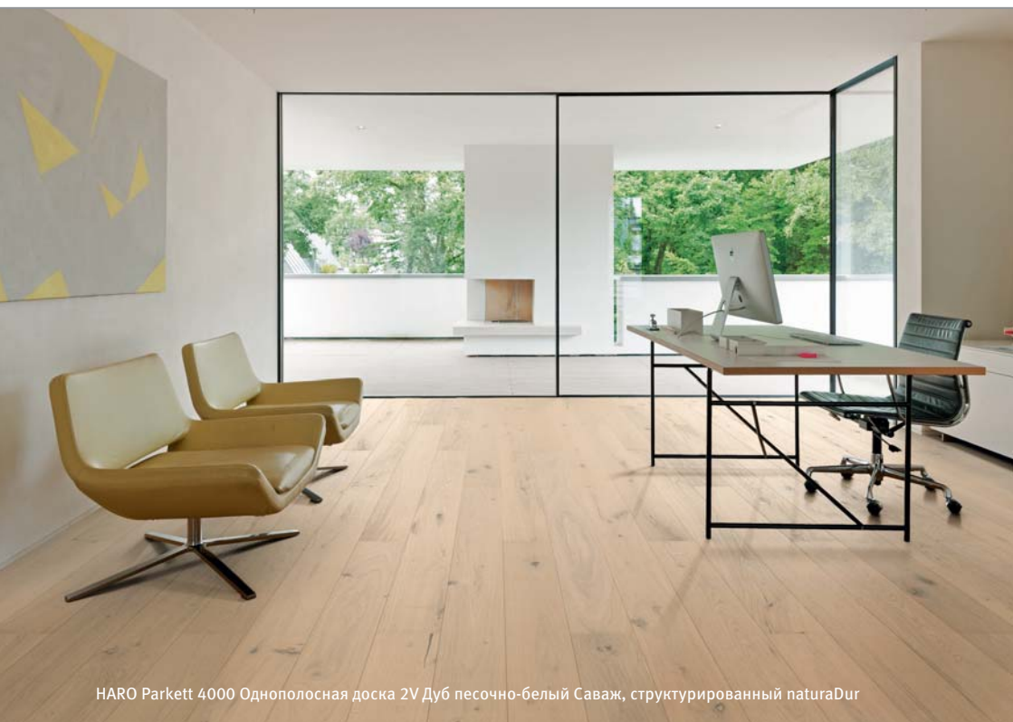
HARO Parkett 4000 Однополосная доска 2V Дуб песочно-белый Саваж, структурированный naturaDur

Hamberger Flooring GmbH & Co. KG Postfach 10 03 53 83003 Rosenheim Германия