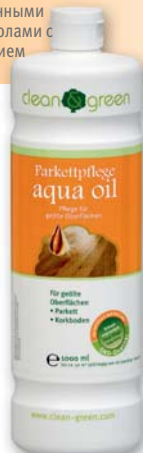
Средство по уходу за паркетом aqua oil